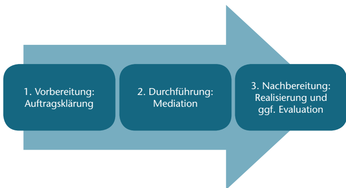
Abb. 1: Prozessschritte der Mediation (Frohn, 2013 a)

Grob betrachtet umfasst das Mediationsverfahren drei Prozessschritte (Frohn, 2013 a):