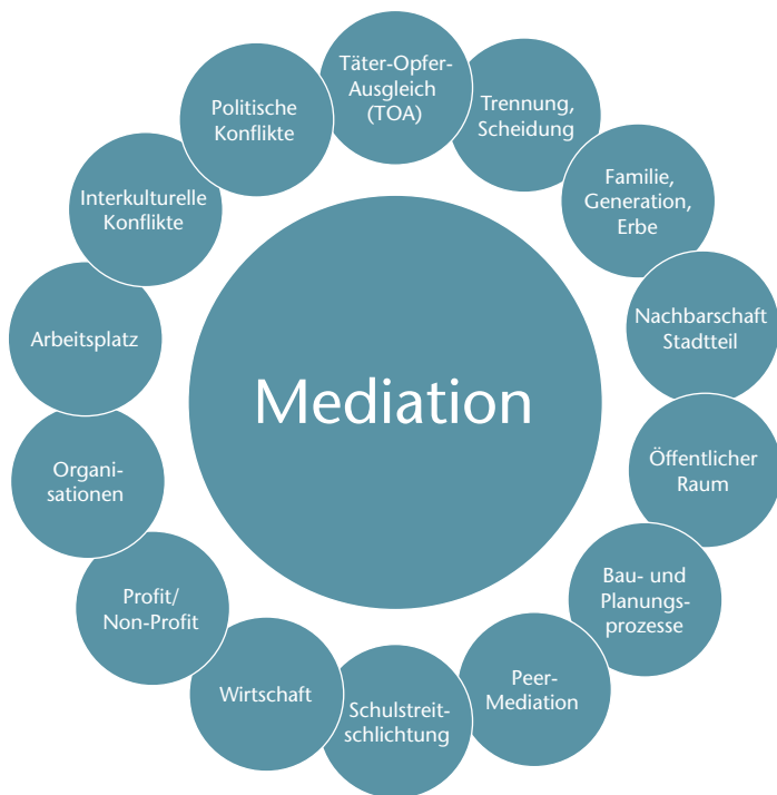
Abb. 3: Anwendungsbereiche der Mediation

Die Mediation findet in vielen sehr unterschiedlichen Anwendungskontexten ihren Einsatz (siehe Abb. 3). Im Anwendungsbereich Schule, Nachbarschaft, in interkulturellen Kontexten, im öffentlichen Raum und auch im strafrechtlichen Kontext (Täter-Opfer-Ausgleich) finden mit dem Verfahren der Mediation hilfreiche Interventionen für einen gelingenden Umgang mit Konflikten statt. Besonders verbreitet ist die Anwendung der Mediation im Zusammenhang familiärer Konflikte (Paare, Familie, Erbschaft, Trennung und Scheidung) sowie bei Konflikten im Bereich Arbeit und Wirtschaft (siehe auch den Beitrag von Beate Storner in dieser Ausgabe). In der Regel findet die Mediation hier als Intervention bei einem bereits eskalierten Konflikt statt. Neu etabliert sich in bestimmten Anwendungskontexten die Medi-